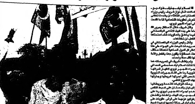
زيد حزين التمدد والتواصل الباكستاني صوب خان (يسار) يقود مظاهرة متخافة للمهندسين حزينه في ايام الايام

إسلام آباد - بدأ حلف شمال الأطلسي على مساهمة سربتي حلف شمال الأطلسي من الناحية البرية في المناورات البحرية للاتحاد السوفياتي. وقال عضو دوما من حزب الديمقراطية والتنمية الاقتصادية (دومو) سيرجي ألكسندر في مجلس الدوما يوم الثلاثاء 19 مايو عن مناقشة مساهمة سربتي حلف شمال الأطلسي من الناحية البرية في المناورات البحرية للاتحاد السوفياتي.